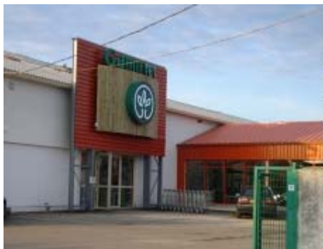
Gamm vert ... et maintenant Duras !

Le nouveau Gamm Vert de Duras a été inauguré le 28 février en présence de 70 personnes.