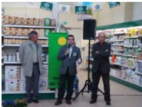
L'heure des discours

Une cinquantaine de personnes a participé à l'inauguration du nouveau Gamm Vert de Castillonnès.