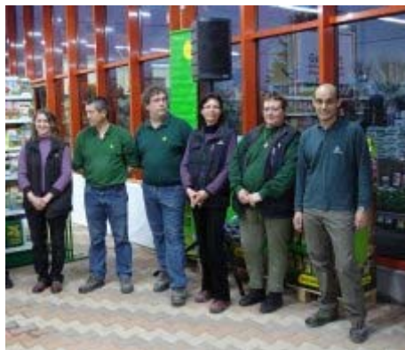
L'équipe à l'heure des remerciements