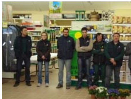
L'équipe dans son tout nouveau Gamm vert

Nous vous attendons nombreux dans nos Gamm vert, les magasins du R Urbain !